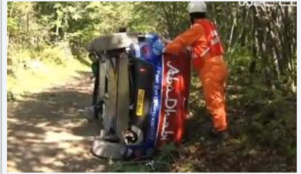
Até arrancou a àrvore...