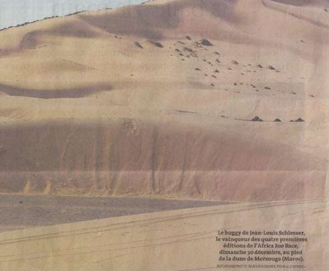
Le buggy de Jean-Louis Schlesser, le vainqueur des quatre premières éditions de l'Africa Eco Race dimanche 30 décembre, au pied de la dune de Merzouga (Maroc).